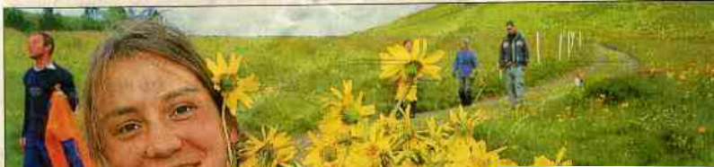
Au Markstein, la cueillette de l'arnica, très réglementée, est réservée aux professionnels.

La pomnade à l'arnica soigne à merveille les contusions et les bleus des petits et des grands. L'huile de massage à l'arnica détend les muscles des sportifs. Mais d'où vient cette plante médicinale sauvage? Des Vosges, des Alpes ou de Roumanie. L'arnica montana pousse sur les sols pauvres, des chaumes des Hautes-Vosges en particulier. Le Markstein est la zone de cueillette la plus importante de France : elle s'étend sur 130 hectares. Une demi-douzaine de laboratoires cosmétiques et pharmaceutiques de France, de Suisse et d'Allemagne viennent chaque année, en juillet, pour y cueillir